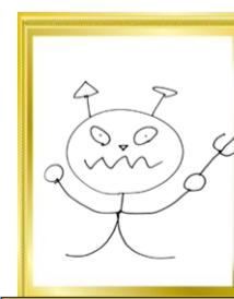
つきみ野湘南保育園