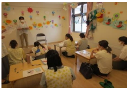
◆保育士への歯科指導の様子◆